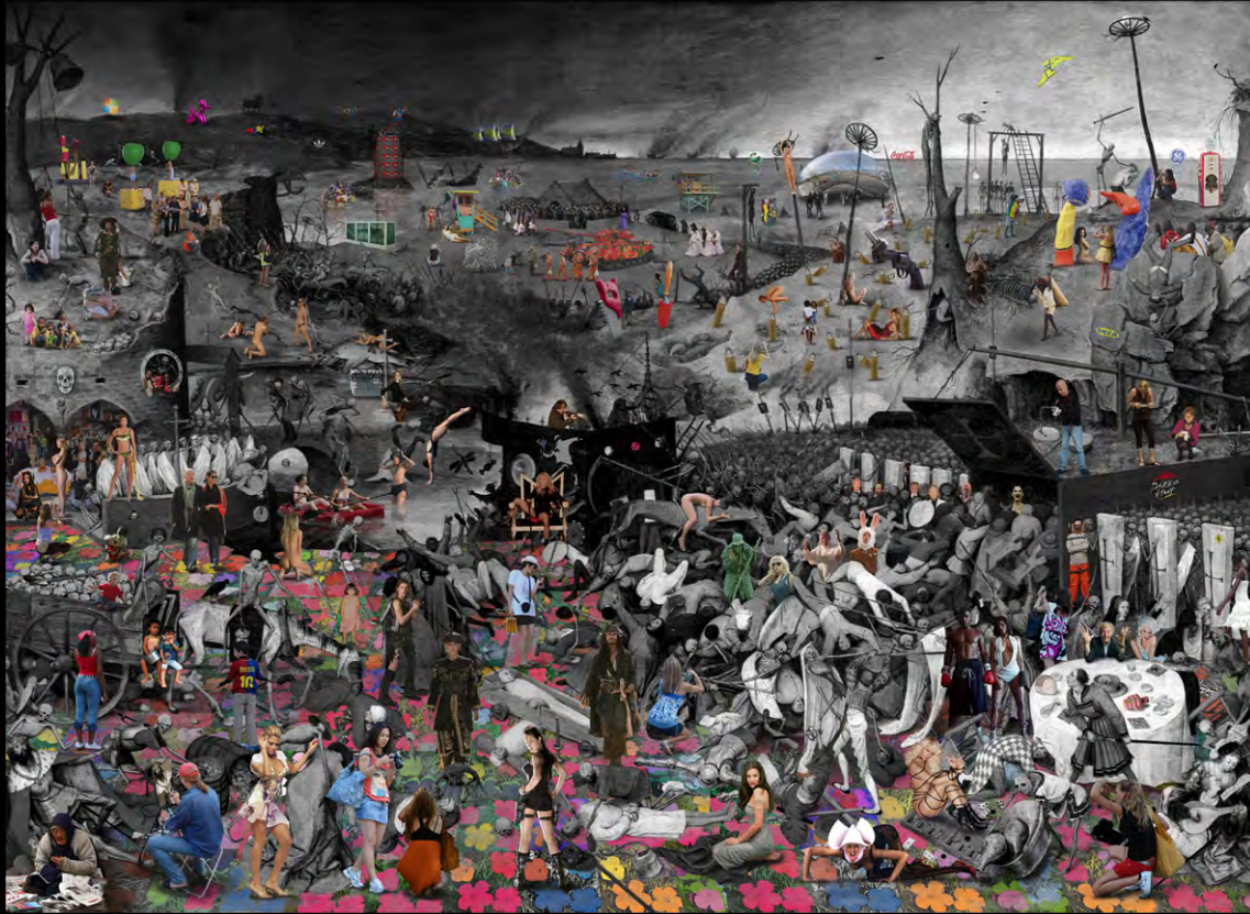
El triunfo de la muerte en Diasac en el centro de la pared exterior